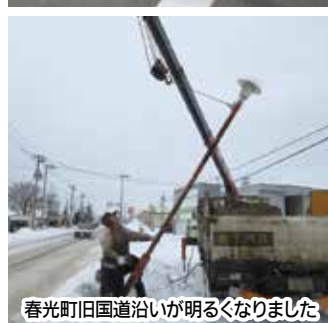
春光町旧国道沿いが明るくなりました