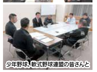
少年野球、軟式野球連盟の皆さんと