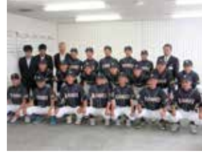
祝!!全国大会出場 高栄中野球部と市長室へ