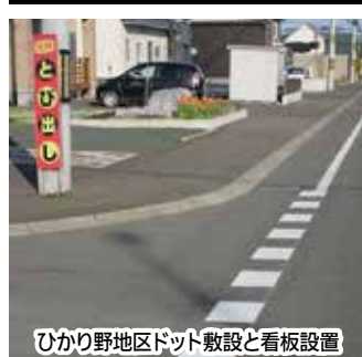
ひかり野地区ドット敷設と看板設置