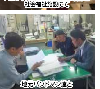
地元バンドマン達と