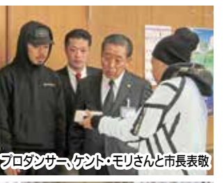
プロタングメント・モリさんと市長表敬