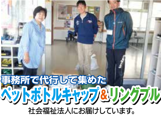
事務所で代行して集めた ペットボトルキャップ&リングプル 社会福祉法人にお届けしています。