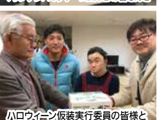
ハロウィン仮装実行委員の皆さんと 社会福祉施設にて