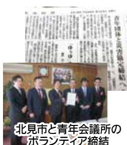
北見市と青年会議所のボランティア締結

平成28年(9月) 第3回定例 北見市議会 質問 災害時に市民に安心感を与えるためにも、地元青年団体などと災害時におけるボランティア活動等に関する協定を結ぶべき。 市の答え 今後関係団体と協議し、本市に適した協定締結に向け取り組みたい。 質問 成年後見人が必要とする障がい者が増えていると聞くが、制度の啓蒙・啓発の考え方を聞く。 市の答え 本人や親族、障害福祉サービス事業者等への普及・啓発に努める。 質問 市民の利便性向上のため、市税などのコンドレ払いを可能にすべき。 市の答え 費用対効果などの課題があり、引き続き研究したい。