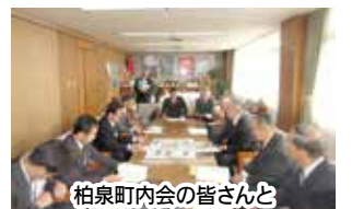
柏泉町内会の皆さんと