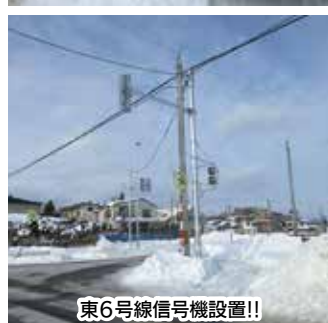
東6号線信号機設置!!